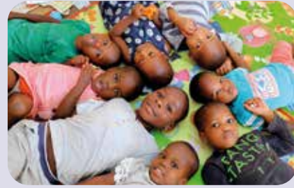
Kinder Toro Babies Home, Uganda