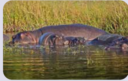
Nilpferd-Mutter mit Kindern, Botswana