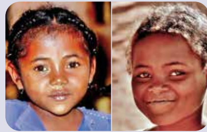
2 Mädchen, Madagaskar