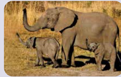
Rüssel hoch im letzten Abendlicht, Zimbabwe