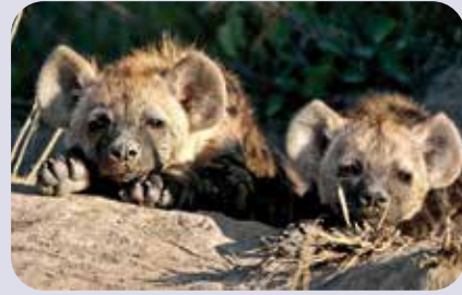
Baby-Tüpfelhyänen, Südafrika