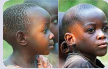
Kinder, Namibia