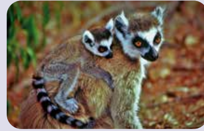
Katta mit Kind, Madagaskar