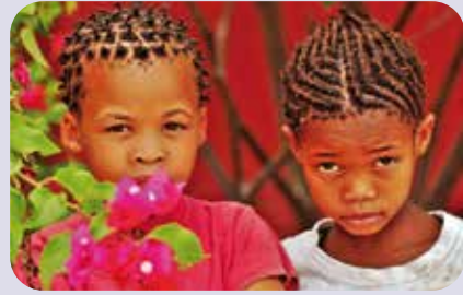
2 Kinder, Namibia