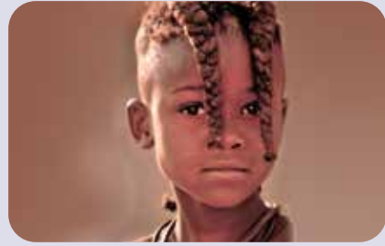
Himba-Junge, Namibia