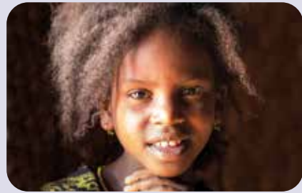
Mädchen, Äthiopien