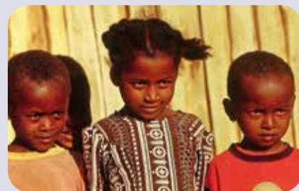
Titelbild: Kinder, Madagaskar